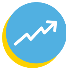
Tren yang berkembang